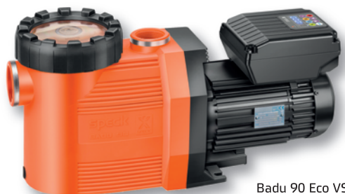
Badu 90 Eco VS