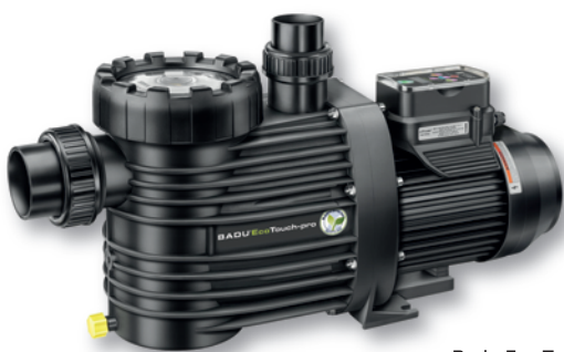
Badu Eco Touch-Pro