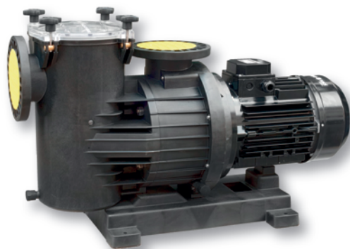
Magnus - s předfiltrem / with pre-filter Kontra - bez předfiltru / without pre-filter