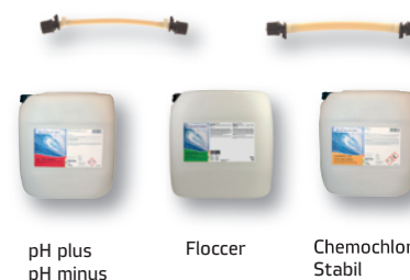
pH plus pH minus